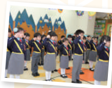
▲ 交通安全隊精神奕奕又整齊