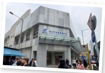
油尖旺地區康健中心 ▶