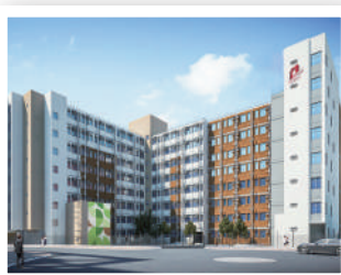
▲ 彩虹彩興路「樂屋」項目為全港首個樓高8層的過渡性房屋項目，共提供329個單位