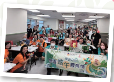
▲「樂善之友」義工探訪長者

樂 善堂於2009年成立「樂善之友」義工團，旨在推動社會大眾參與義務工作活動。「樂善之友」透過服務配對及舉行不同之義工活動，包括社區探訪等，鼓勵來自不同界別的義工為社會弱勢社群送上關懷；並冀望義工回饋社會同時，於個人成長中有所得著，各展所長。「樂善之友」由成立至今，累積參加義工人數已超過 18,000 人次。