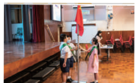
▲ 開學禮升國旗儀式