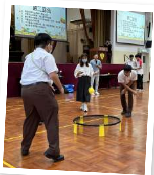
▲ 參與學生在運動競技工作坊中體驗賭博如何影響自身成長

本堂一直關注青少年成長需要及身心靈的健康，致力推動學生健康工作。本堂獲保安局禁毒處資助，為轄下6間中學推行健康校園計劃—「陽光青年計劃」，同時為港島及離島、九龍東、九龍西及新界東的小學推行「無毒新世代」學生抗毒教育服務。此外，本堂亦獲平和基金資助推展 屹立不「賭」—青少年預防賭博及推廣活動 ，為本港中學生宣揚健康無賭的訊息。