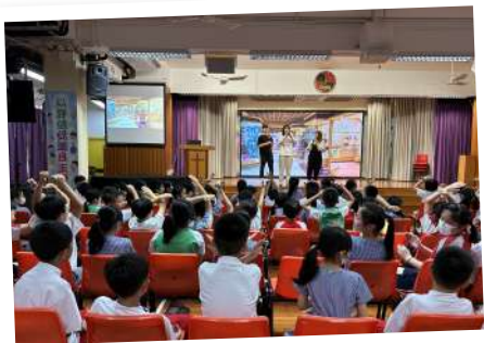
▲ 「無毒新世代」— 小學生在互動劇場中投票決定主角走向