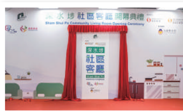
活動策展 (深水埗社區客廳開幕禮) ▲

業務主要為不同企業、團體、政府部門及學校提供各種多媒體設計及製作服務，包括：廣告/短片製作、活動策展、活動攝影、平面設計、產品印刷及插畫製作等服務一應俱全。為擴展業務和提供多元化服務，團隊亦設有社交媒體創作、網上廣告管理、設計及攝影組合等，讓客戶於訂閱期間以更優惠價錢得到不同的製作服務，加強推廣效果。