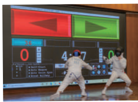
▲ 推廣多元課外活動， 發展學生體藝才能