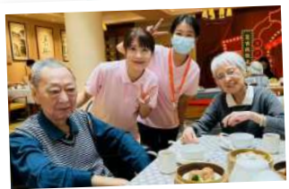
▲ 長者在內地院舍生活花絮