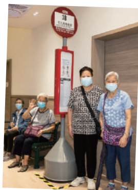
▲ 樂善堂標準錶針長者日間護理中心

此外於2023年起，兩間敬老鄰舍中心亦參與由香港賽馬會慈善信託基金策劃及捐助的賽馬會「e健康」電子健康管理計劃及賽馬會「與耆同絡」長者平板電腦及線上支援計劃，為參加者提供多元健康管理課程和活動，另外亦向參加者提供平板電腦，以資訊科技產品學習新事物。