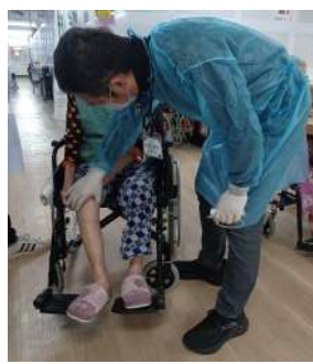
▲ 外展醫生為住院院友提供醫療支援