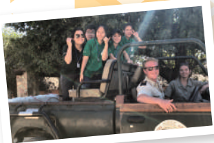
▲ 在南非野生動物保育區與世界各地義工交流

九 龍樂善堂於1880年成立，以「救災紓困、贈醫施藥、興學育才、安老培幼」為宗旨。尤其在「興學育才」範疇上，本堂前人打破古時「女子無才便是德」的守舊觀念，認為男女應平等接受教育。在1929年，先後開辦女子及男子義學，為兒童及青少年提供免費教育和學習的機會；其後更自資籌建及接辦多間政府資助中、小學，造福莘莘學子，打下百年樹人的基礎。