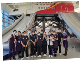
▲ 參觀香港航空，與機師及空中服務員見面及交流，訂定未來發展方向