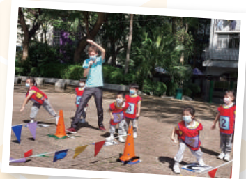
▲ 齊來體驗做運動員的歡樂和自豪