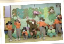
配合音樂和故事遊學習英語