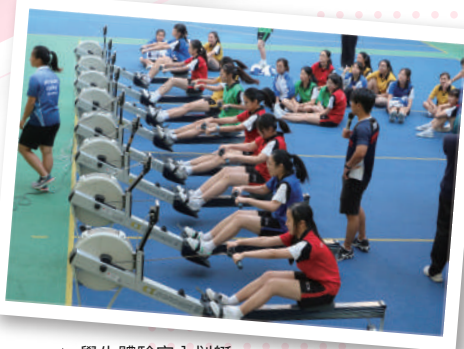
▲ 學生體驗室內划艇