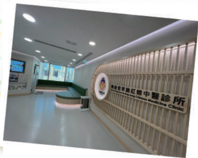
▲ 樂善堂李施紅娘中醫診所