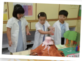
▲ 學生化身小小科學家，動手做科學實驗