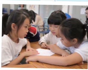
▲ 通過合作學習，一起解決問題