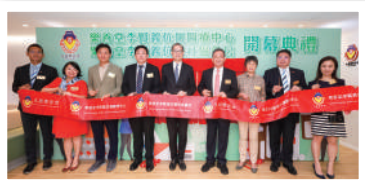
◀ 活動策展 (社區藥房開幕禮)