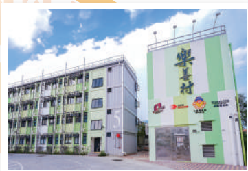
▲ 大埔「樂善村」過渡性房屋項目，提供1,236個單位