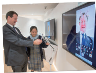
▲ 同學介紹人工智能程式應用