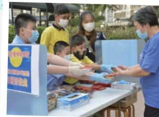
▲ 為長者送上中秋愛心月餅