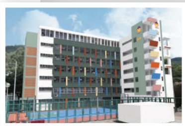
▲ 位於荃灣象山邨的改建學校項目，約提供145個單位