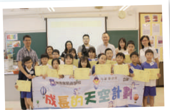
▲ 小四-迎新啟動暨家長教師分享會