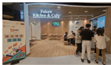
Future Kitchen & Café ►

營養的餐飲服務；同時為區內弱勢社群提供就業及培訓機會，幫助他們在未來實現自力更生。單位引入智能煮食設備平台，並針對吞嚥困難患者，提供不同膳食等級選擇。