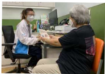
◀ 護理統籌主任為市民進行免費健康風險評估和配對家庭醫生

地區康健站職員透過家訪為長者提供健康評估，了解他們的健康狀況及需要，並提供適切的支援服務 ▶