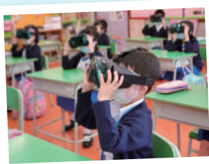
▲ 學生利用VR進行虛擬實境學習