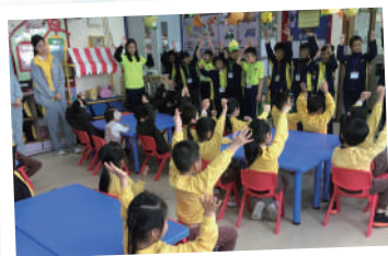
▲ 小四愛心之旅，學生到學校附近的幼稚園當小義工