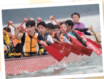
▲ 學生們參與龍舟訓練