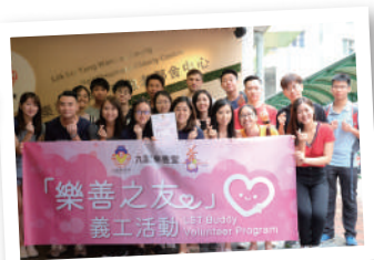
▲「樂善之友」義工活動