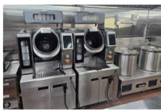
◀ 項目引入人工智能炒菜機械人，能夠精準控制烹飪過程