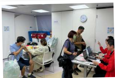
◀ 為市民提供季節性流感接種服務及疫苗推廣教育

地區康健中心及康健站的專職醫護人員根據市民的性別、年齡及家族病史，為他們提供個人化的健康關注建議及制定以預防疾病為主的健康人生計劃。