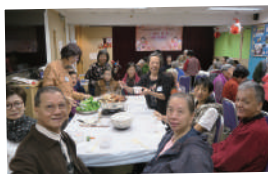
▲ 由義工製作食物，會員享用的冬至聚會