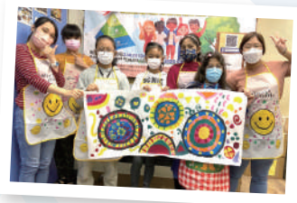
▲ 泰裔及南亞裔兒童參與巨型圖形畫活動