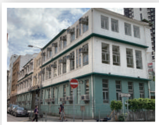
▲ 全港首個「改建校舍」作過渡性社會房屋項目，提供51個單位，2020年8月獲發入伙紙