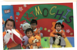
▲ KIMOCHIS情智教育協助兒童認識及管理情緒