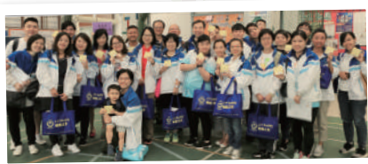
▲「樂善之友」企業義工參與探訪活動