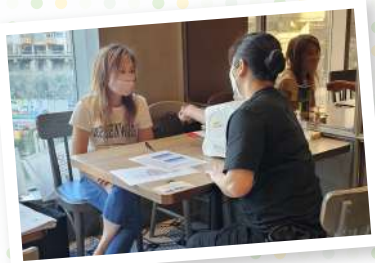
▲ 「愛·無煙」註冊護士在飲食企業餐廳分店為員工提供健康檢查及諮詢