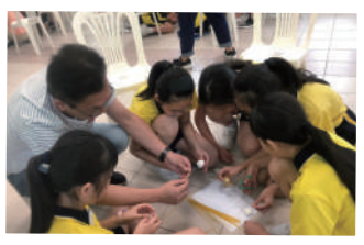
▲ 透過合作遊戲促進親子的溝通，深入了解子女的特質