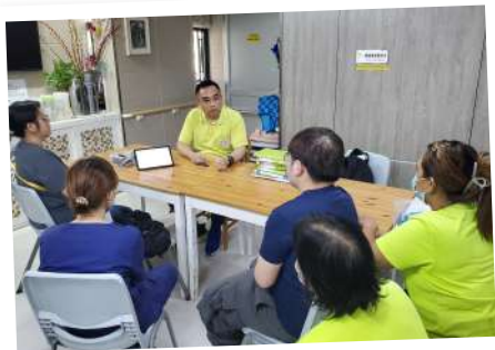
▲ 外展醫生定期為院舍職員提供專業培訓

本堂於2018年10月起接受社會福利署委託，為所有居於九龍城及油尖旺區私營及自負盈虧安老院和殘疾人士院舍之院友，提供免費外展醫生到診服務。由服務開展至今，累計參與院舍數目已達140間，為超過215,000人次提供到診及配藥服務。為促進院友健康、減少院友外出治療的壓力及經濟負擔、並於社區建立基層醫療健康服務支援網絡，外展醫生定期以外展形式到院舍，為院友提供一站式醫療服務，包括免費基礎診治及藥物治療、監察院友健康狀況、身體檢查及評估、轉介跟進、健康講座及職員培訓、電話諮詢及支援服務等，務求讓住院院友能安坐於院舍內接受貼心的照顧。