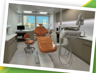
▲ 樂善堂駿英牙科診所