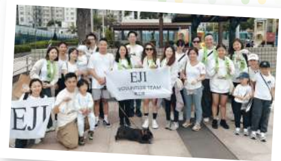
▲ 企業義工參與「無煙萬步行」活動及沿途清理棄置煙頭

其中「愛·無煙」前線企業員工戒煙計劃是以協助企業推動無煙文化為目標，以外展形式提供多元化的戒煙服務。計劃一方面為企業提供健康講座及戒煙輔導服務，另一方面致力推動企業建立內部無煙政策，從硬件配套、企業形象、社會責任、職安健及內部培訓等多方面為企業設計及籌辦具可持續性的員工健康方案，為企業及員工帶來正面的效益。計劃由2013年開展至今，累計為超過4,300名吸煙員工提供戒煙輔導服務。