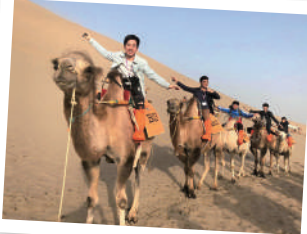
▲ 甘肅考察認識不同文化與地貌，增廣見聞